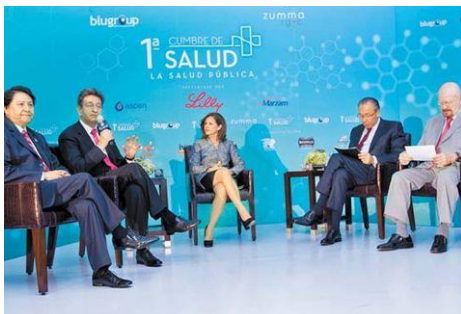
Primera Cumbre de Salud Pública Lugar: Torre Mayor CDMX Fecha 9 de mayo de 2017