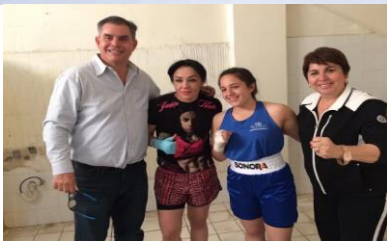
Semana de la cultura física y el deporte Todos contra las Adicciones en Nogales Lugar: Nogales, Son. Fecha: 2 de abril de 2017