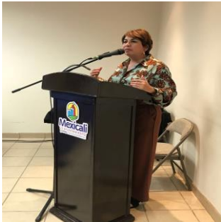
Celebración del Día Mundial de la Salud Mental Lugar: Centro Misión San Carlos, Mexicali, BC Fecha: 9 de octubre de 2017