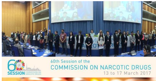
Participación en la 60 Sesión de la Comisión de Estupefacientes de la ONU Lugar: Viena Austria Fecha 14 a 17 de marzo de 2017