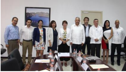
Visita al Programa de Justicia Terapéutica en el Estado de Chiapas Lugar: Fiscalía General del Estado de Chiapas Fecha: 4 de agosto de 2017