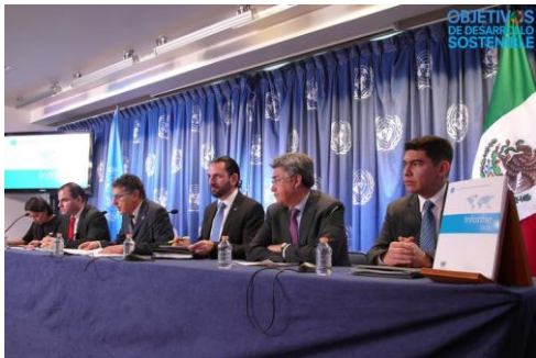
Presentación del Reporte Mundial sobre Drogas 2017 Lugar: Sede común de las Naciones Unidas en México Fecha: 2 de marzo de 2017