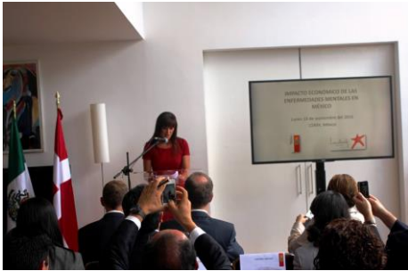
Seminario: Impacto Económico de las Enfermedades Mentales en México Lugar: La Residencia de Dinamarca Fecha: El 19 de septiembre del 2016